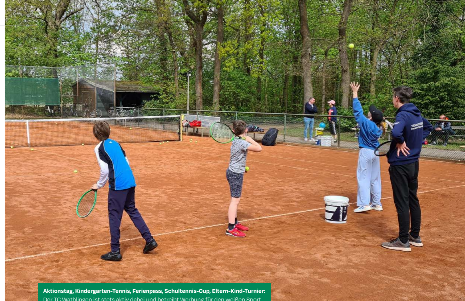
Aktionstag, Kindergarten-Tennis, Ferienpass, Schultennis-Cup, Eltern-Kind-Turnier: Der TC Wathlingen ist stets aktiv dabei und betreibt Werbung für den weißen Sport.

Angebote, Aktionen und Ansprechpartner im Überblick →