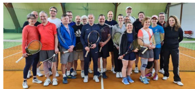
Die Tennis-Asse verbrachten einen langen Tag in der Nienhäger Halle und stellten ihre Ausdauerfähigkeit unter Beweis.