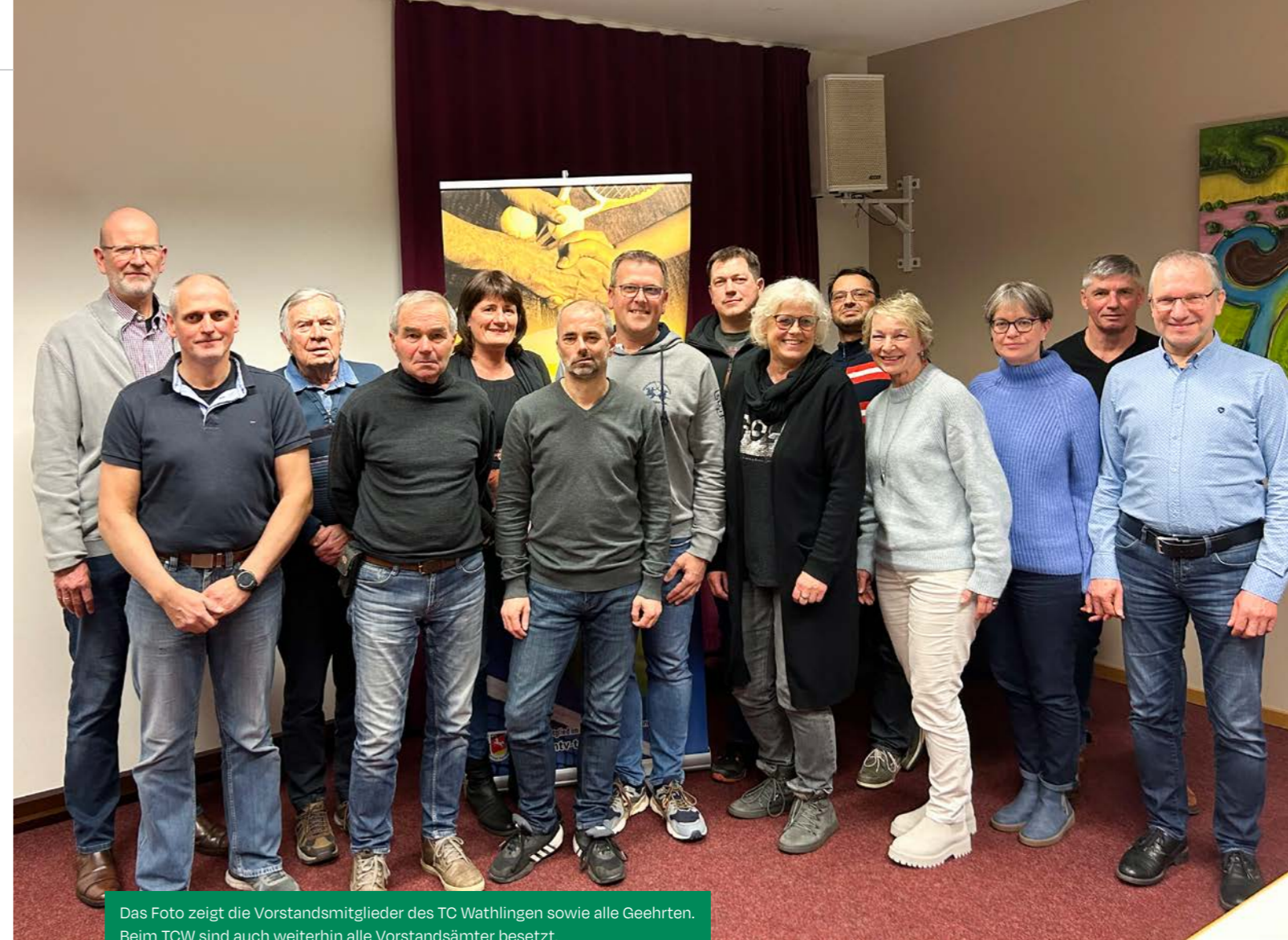
Das Foto zeigt die Vorstandsmitglieder des TC Wathlingen sowie alle Geehrten. Beim TCW sind auch weiterhin alle Vorstandsämter besetzt.