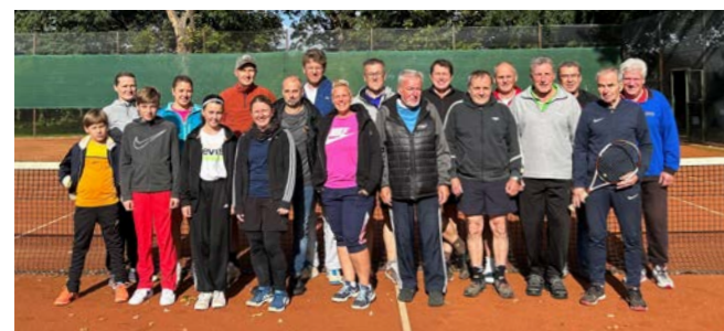
Beim Saisonabschlussturnier für jedes Alter wurde noch ein letztes Mal unter freiem Himmel zum Schläger gegriffen.

Mehrere Stunden wurde in wechselnden Formationen Mixed und Doppel gespielt. Insgesamt 24 Spielerinnen und Spieler ließen das Racket schwingen und/oder verbrachten einen wunderschönen gemeinsamen Abend im Clubhaus. So ziemlich jede Altersklasse war vertreten. „Das war noch einmal ein gelungener Ausklang. Besonders erfreulich war, dass sehr Viele dabei waren, die noch nicht lange Mitglied im TCW sind. Für unser Vereinsleben ist das überaus erfreulich“, erklärt TCW-Sportwart Oliver Schreiber. In diesem Jahr findet das Saisonabschlussturnier am Samstag, 12. Oktober, statt.